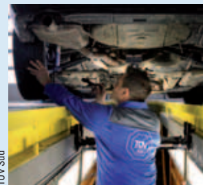
Fahrzeugmängel unter der Lupe TÜV Süd

Der Anteil der Fahrzeuge mit erheblichen Mängeln auf Deutschlands Straßen ist um 0,2 Prozentpunkte auf 19,7 Prozent angestiegen. Das geht aus dem TÜV Report 2012 hervor. Für den aktuellen Report wurden insgesamt 7,8 Millionen Hauptuntersuchungen ausgewertet, die zwischen Juli 2010 und Juni 2011 durchgeführt wurden.