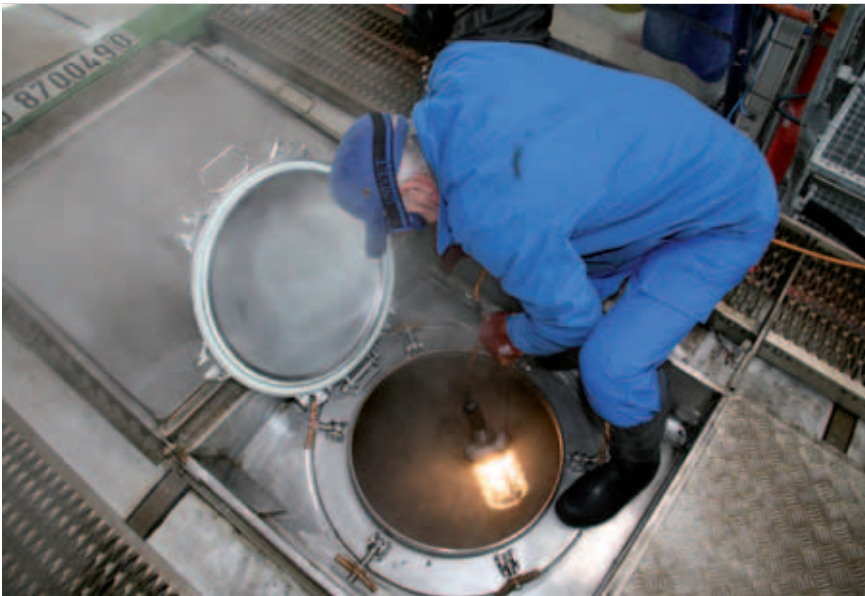
Der Reinigungsmeister überprüft, ob der Tank vollständig gereinigt ist

verladende Industrie den Erfolg des ECD und die Sicherstellung der fachgerechten Entsorgung und Reinigung weiter fördern, indem sie nur noch dieses Formular für alle Reinigungen in ganz Europa anerkennt.